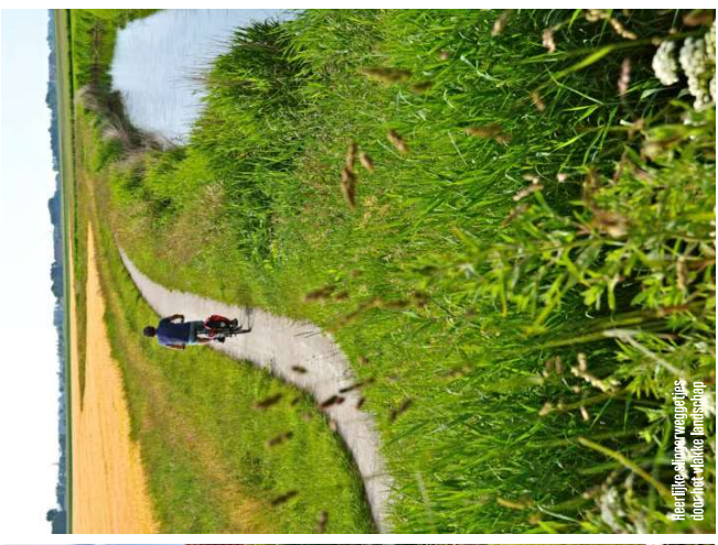
Heerlijke alpenweidings door de Waddelandse Buitenschap