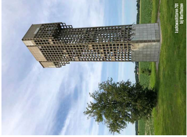
Luchtwaachtoren 701 bij Warhuizen