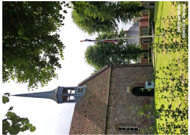
De kerk van Niehove, gebouwd in de 13de eeuw