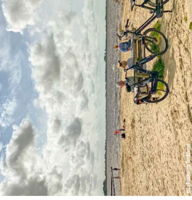
Het glinsterende Schildmeer